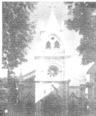
→年，鹿礁路31号 天主教教堂建于1916