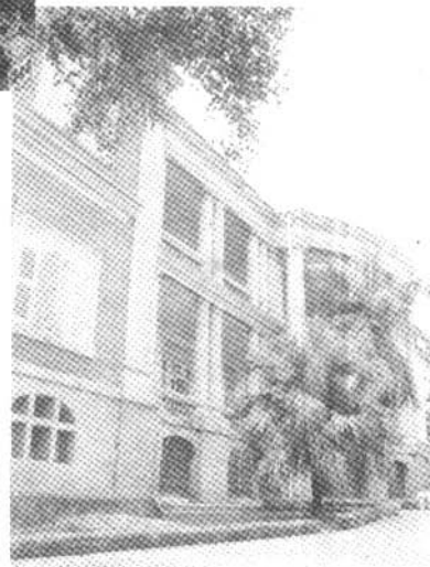
↑“八卦楼”建于1907年， 欧陆建筑代表，鼓新路43号