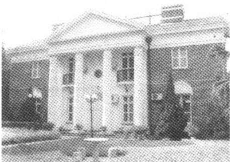
↑原美国领事馆，始建于1865年，翻建于1930年，三阳路26号