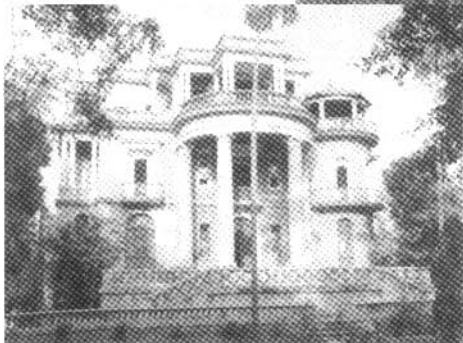
↑“黄荣远堂”别墅，1920年越南华侨建，福建路32号