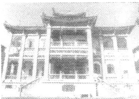
↑“海天堂构”，20世纪初菲律宾华侨建，福建路38号

的保护，在上世纪90年代，曾做了大量卓有成效的保护工作，例如组织有关部门在岛内调查近代建筑的保存情况，聘请天津大学设计专业师生对一批重要历史风貌建筑进行实地考察、测量，并整理、出版了有关著作，编写形式多样化的宣传资料。这些工作的开展，为鼓浪屿近代历史风貌建筑走向法制化管理轨道奠定了良好的基础。